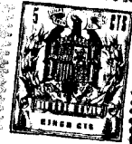
Fig. 1. a 1895