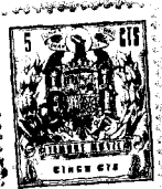
Fig. 1 a