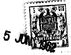
Fig. 1 93480