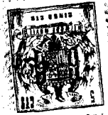
FIG.1 93242 FIG.2