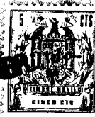
fig. 2. a