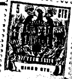
figura 1ª 92216 figura 2ª