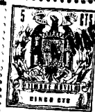
figura 1 a