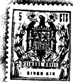
Fig. 1 a