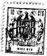
Fig - 1