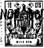
Fig - 1