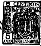
Fig. 1 81258