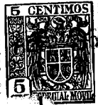
FIG. 1 80451