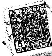
FIG. Nº 1