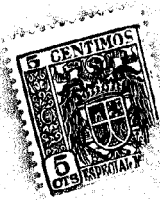
Fig. 1 a