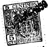
FIG. 5 a