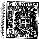
Fig. 1 a