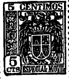
Fig. 1 a