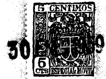
Fig. 1 a