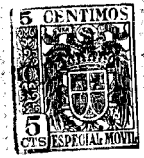
FIG. 1. 67570