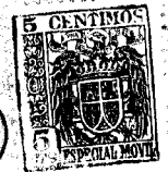
Fig. 1ª 67497