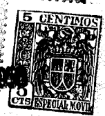
Fig. 1: 66834