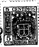
Fig. 1 66698