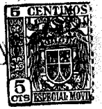
Fig. 1 ° 6 648 1