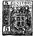
Fig.1 Fig.2 Fig.3 Fig.4