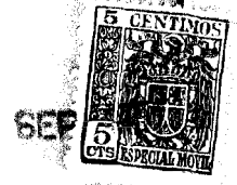
FIG. 1 61778