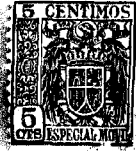
Fig. 1. • 61498