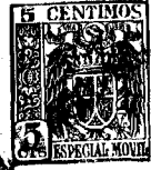
Fig. 1 ° 61435