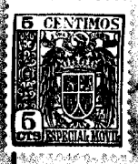
Fig. 1 • 61396