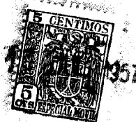
Fig. 1 a