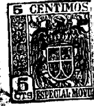
Fig. 1 • 60433