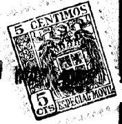
Fig. 1 a 59945