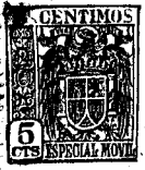
Lámina 1 a (Dos láminas)