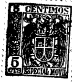
Fig. 1 a