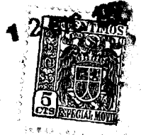
FIG. 2. a