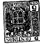
Fig. 1 • 56384