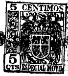
FIGURA UNICA 56225