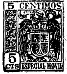
Fig 1 a