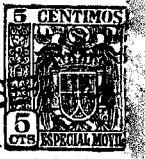
FIG. 1 • 56100 12 S