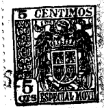
Fig. 1 • 56017