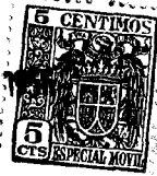
Fig. 1 = 8 JUL