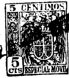
Fig. 1 546 07