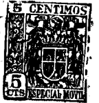
Fig. 1 • 54408