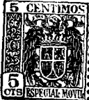
Figura núm. 1