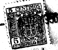
FIG. 1 • 53563