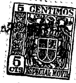
Fig. 1 a