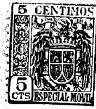
Fig. 1 52162