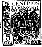
FIG. 1 a 51433 28 N