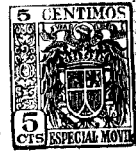
Fig. 1 a