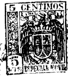
Fig. 1 a