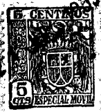
FIG. I 49286